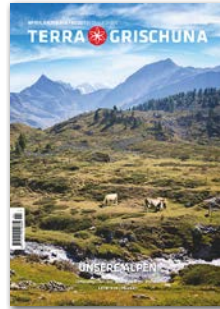
Unsere Alpen Erscheinungsdatum 3. August 2026 Anzeigenschluss 25. Juni 2026