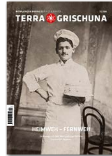
Heimweh - Fernweh Erscheinungsdatum 1. Oktober 2026 Anzeigenschluss 29. August 2026