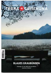
Blaues Graubünden Erscheinungsdatum 1. Juni 2026 Anzeigenschluss 23. April 2026