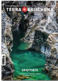
Kraftorte Erscheinungsdatum 1. April 2026 Anzeigenschluss 26. Februar 2026