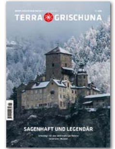
Sagenhaft und legendär Erscheinungsdatum 1. Dezember 2026 Anzeigenschluss 29. Oktober 2026