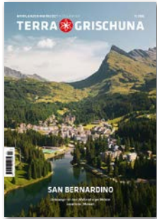
San Bernardino Erscheinungsdatum 2. Februar 2026 Anzeigenschluss 18. Dezember 2025